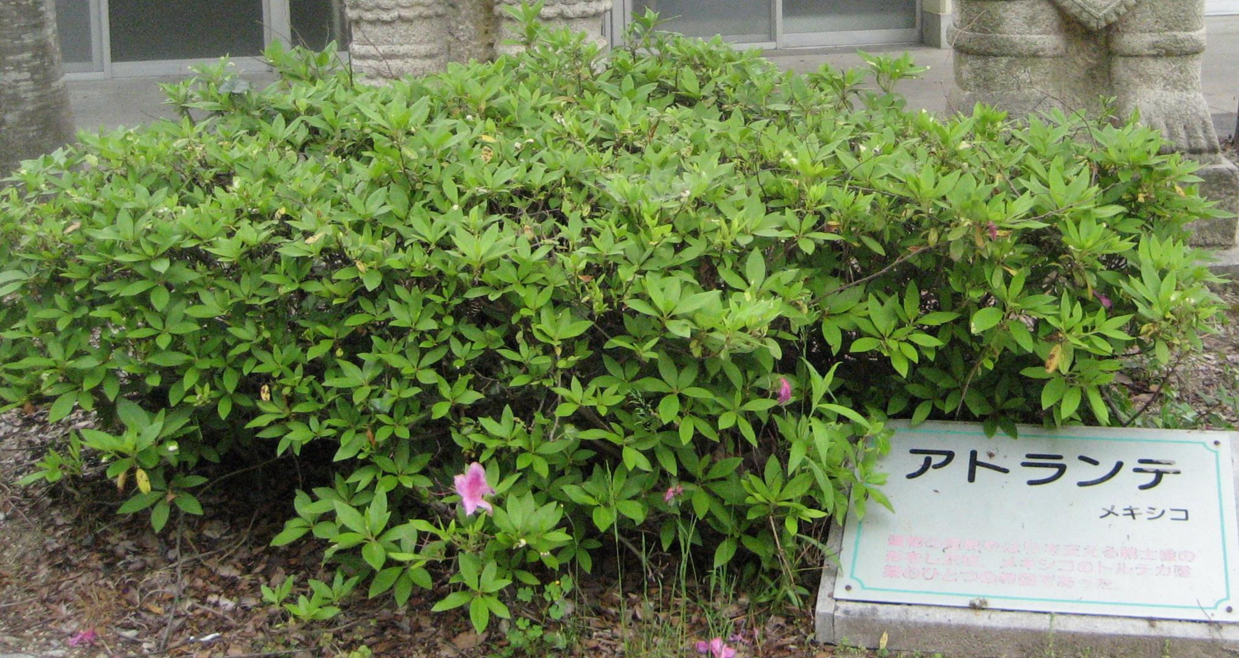
アトランテ メキシコ 彫刻の表現が心ゆくまで見える船士達の 形をとり、メキシコのトルテカ陸 築のひとりの神像であった。