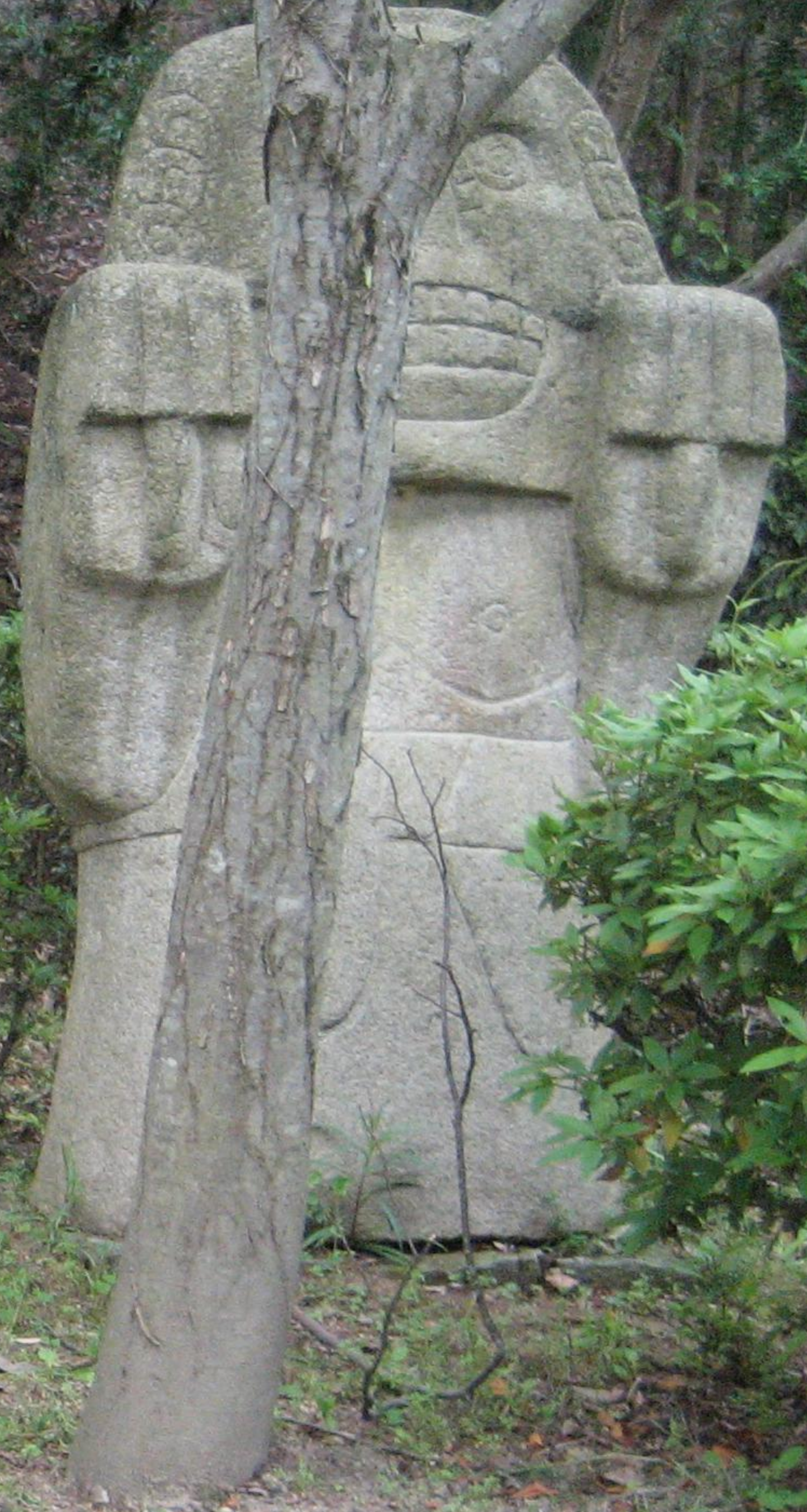
シワテオトル メキシコ 大地の女神シワコアトルの従者であり 出産のときに死んだ女が神になったのが シワテオトルである。