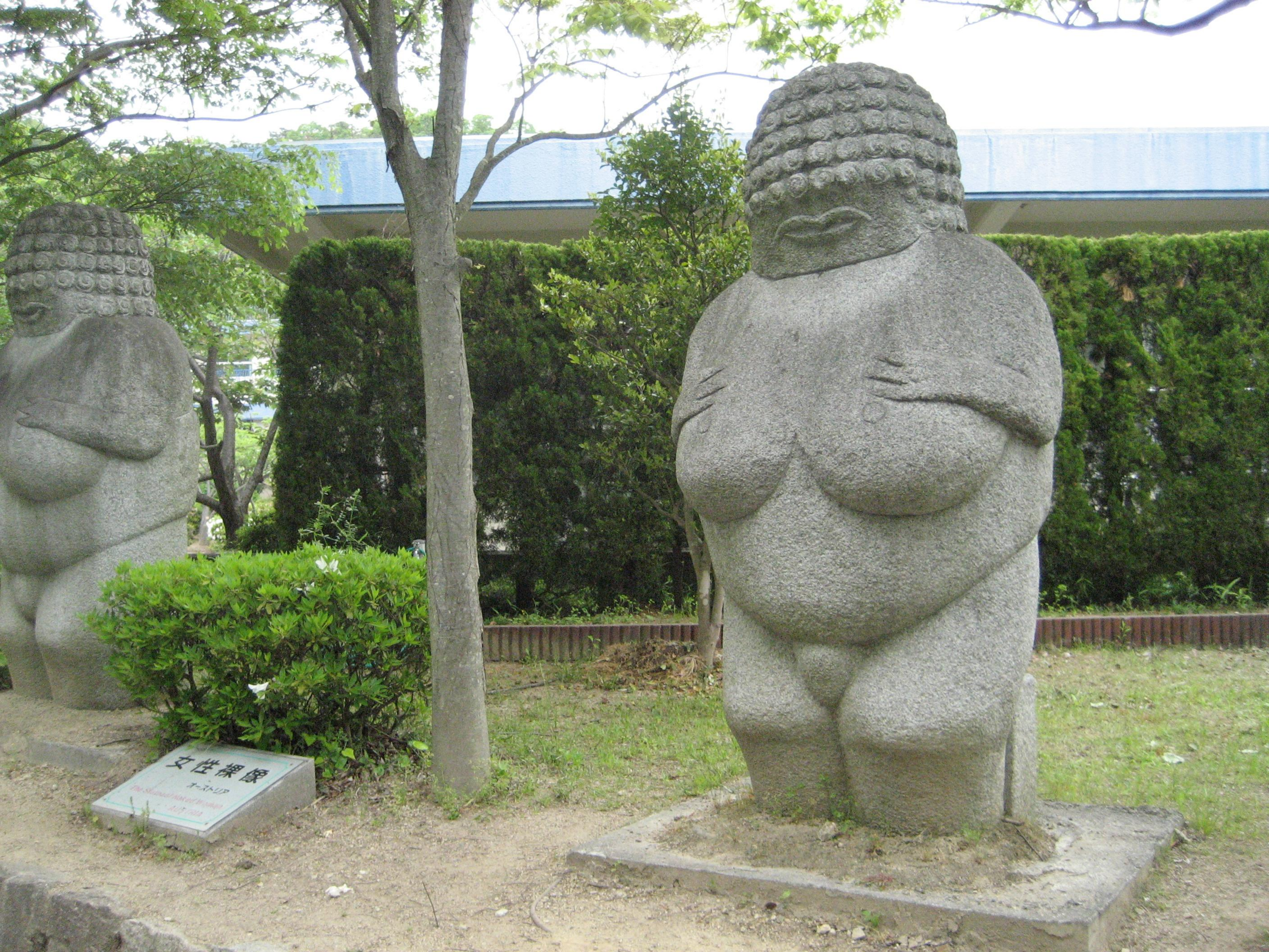
女性裸像 7-7-17 The Naked Image of Woman July 1968