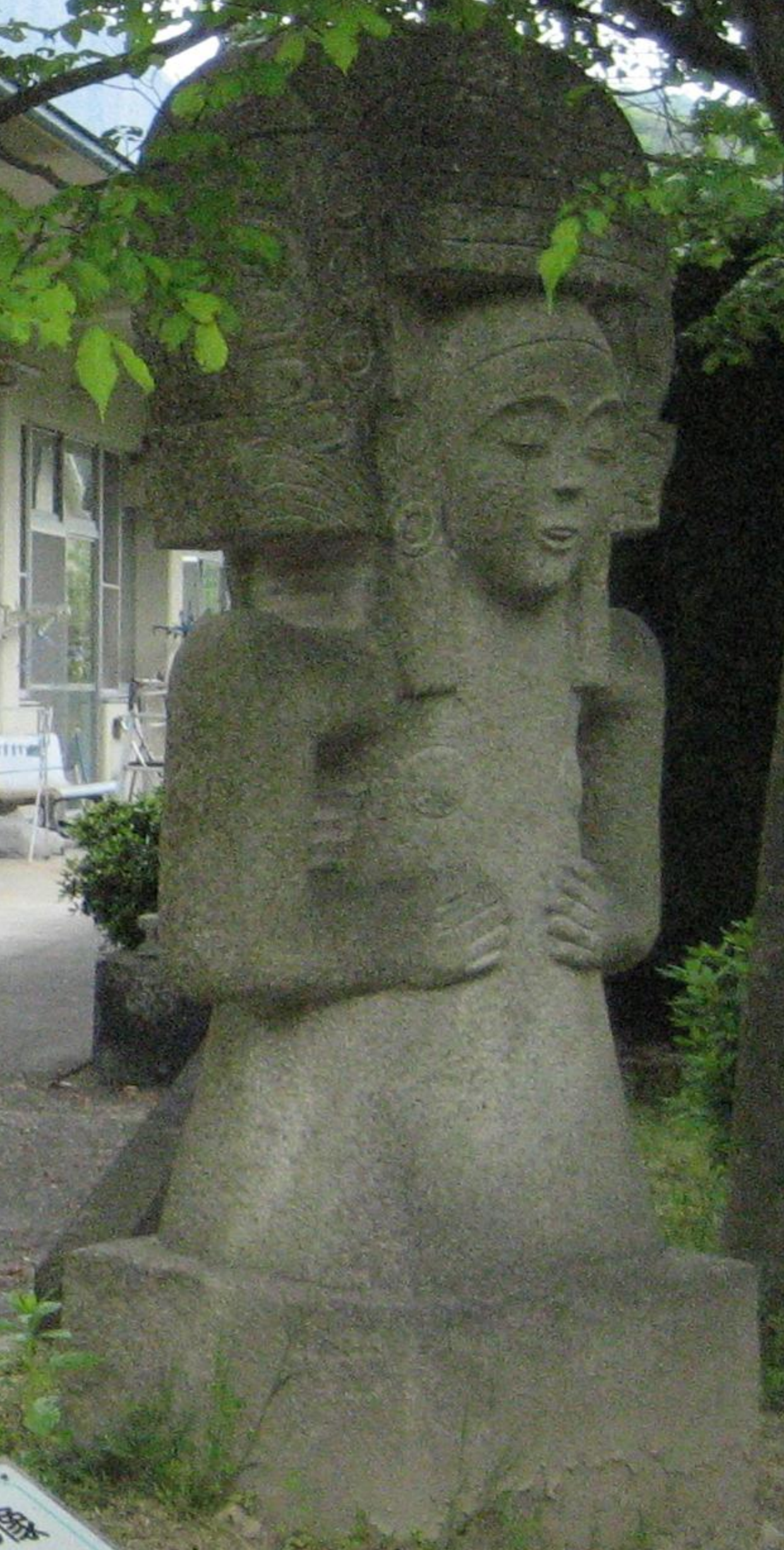
イシユクイケの像 メキシコ 大正と昭和に新神宮の石造り 新築時、皇宮の境内に安置