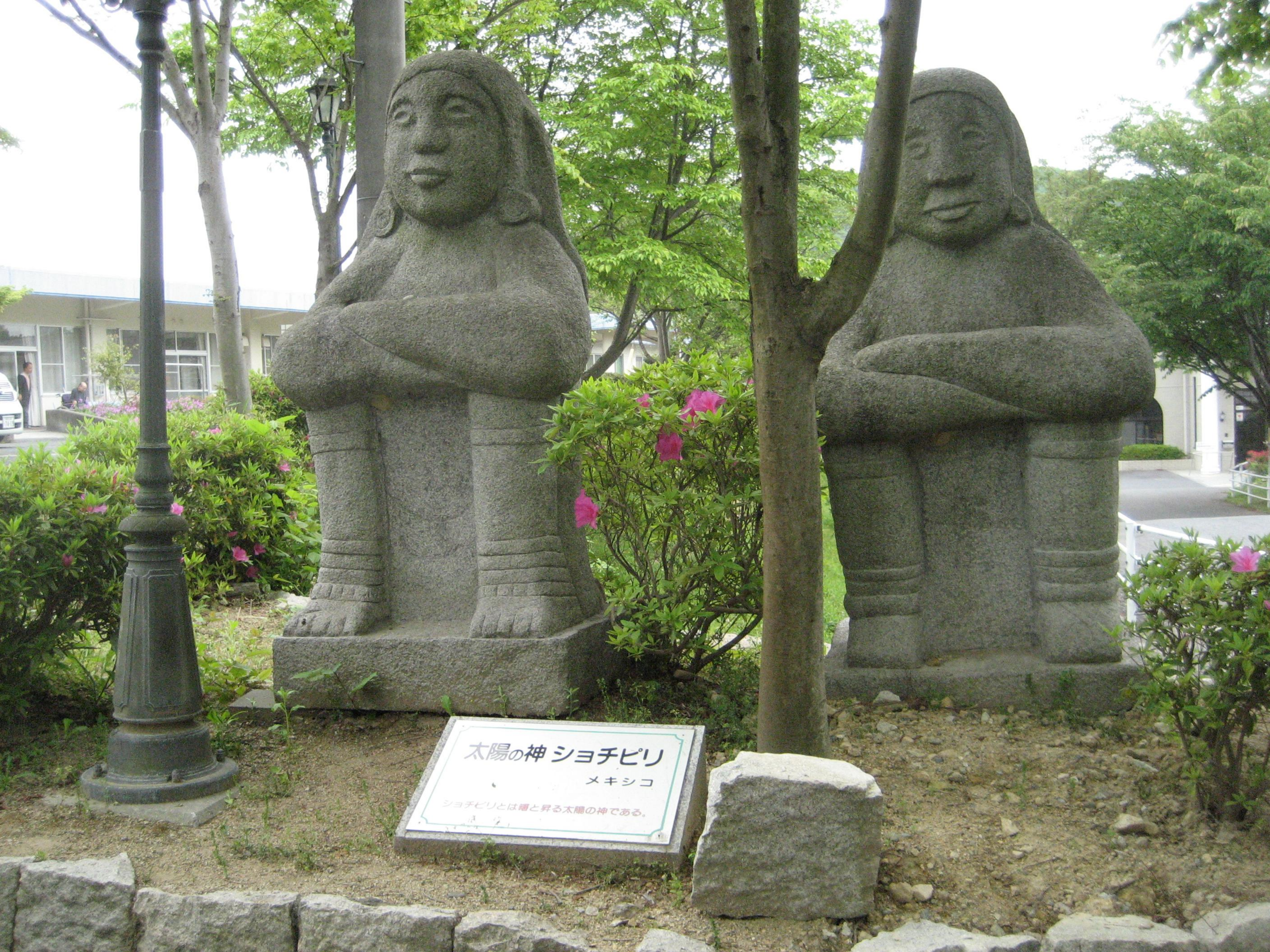
太陽の神 ショチピリ メキシコ ショチピリとは種と昇る太陽の神である。